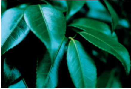
五島の椿ブランドブックより