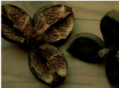
五島の椿ブランドブックより

せっけんの中をつぶつぶは、パウダー状にした椿の果皮。空気を含む繊維スクラブだから、肌あたりもよく、汚れが古い角質を優しく絡めとって、清らかな肌へ。